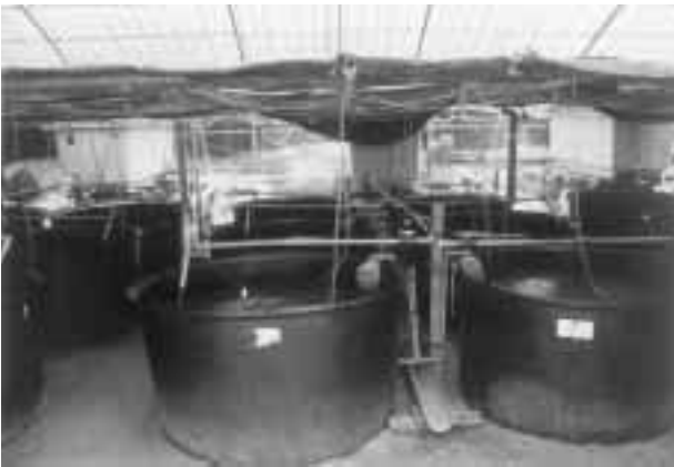
写真2 リュウキュウアユ種苗センター

「リュウキュウアユ種苗センター」は、当会と「源河川にアユを呼び戻す会」、名護市、北部ダム事務所の呼びかけにより集められた資金で建設された施設です。