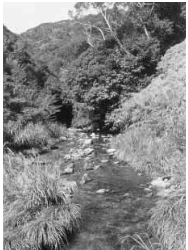
写真6 福地ダム流入河川のサンヌマタ川

リュウキュウアユをやんばるの河川に蘇生させるのに、なぜダム湖に陸封化する必要があるのか。その答えは、人が行う活動には大きな波があるからです。沖縄においても一時期「リュウキュウアユブーム」というほどに、新聞・テレビをにぎあわせていた時期がありました。しかし、リュウキュウアユを蘇生させる活動は、一時のブームで完了するほど簡単なものではありません。たとえやんばるの河川にリュウキュウアユが戻ってきたとしても、ちょっと目を離すとすぐにまたいなくなってしまうでしょう。残念ながら、人の関与なしに、保全・保護は成り立たないのが現状です。現在はまだ河川においては放流なしに、リュウキュウアユの姿を見ることは未だできておりません。