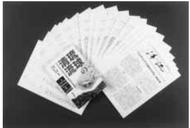
写真3 機関誌「清流」と啓蒙書の「琉球の清流」

当会がリュウキュウアユ復元に向けての拡大会議の呼びかけ人となり、毎年1回国・県・名護市・コンサルタント会社・市民団体等にご出席いただき、このアユの蘇生に向けての取り組みの検討や情報交換を行っております。産官学が一同に会して話し合うことは、情報交換の意味でも大きな成果を