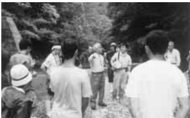
写真5 源河川でのリュウキュウアユの稚魚放流式

河川環境を改善するには、まず第一に河川について関心を持ち、現状を知ってもらう必要があります。理解なくして、河川環境の改善に向けての取り組みが進展することはありません。そのためにも、リュウキュウアユの放流は欠かせない活動の一つとなっております。リュウキュウアユ種苗センターにおいて生産された稚魚の放流は、ほぼ毎年5月から6月にかけて実施しております。1995 - 96年には試験的に名護市の源河川以外のやんばるの3河川でも放流を試みました。この放流は、源河川に比べ河川環境が改善されていないため、良好な結果をえてはおりませんが、放流を通しての意識改革には大きな成果をあげていると考えております。平成12年6月の源河川での稚魚の放流では、稚アユたちがどのような河川環境下にあるかを広く知ってもらうために、同河川において河川見学会を実施しました。また、同年12月には放流した稚アユたちが、どのように成長しているか、産卵はしているか等を観察するために、再度同河川において観察会を実施しました。大きく育ったリュウキュウアユを投網で採捕し、参加者の方々にじかに見てもらいました。私たちの活動がどのように実を結んでいるかを、肌で感じることで感動を覚えた方々も少なくなかったと思います。