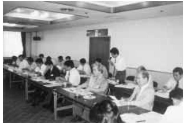
写真4 リュウキュウアユ復元に向けての拡大会議

あげております。特に官庁関係の方々は、どうしても縦割りの行政になりやすく、1部局にリュウキュウアユの産卵時期での河川改修工事の中止をお願いしても、他の部局が工事等により河川に土砂を流し、産卵場をだめにしてしまうことがよく起きました。関係者が一同に会することにより、このような弊害は少なくなりつつあります。河川改修工事は洪水対策等住民の生活にとって大切なことであり、一切の工事を中止することは不可能です。しかし、同じ工事をするにしても、時期を選びなるべく河川に負担のかからない工法を採用することにより、河川や河川生物に対する悪影響を軽減することが可能なのです。