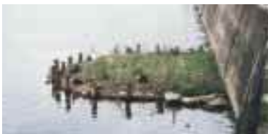
ヨシ原に飛来した水鳥