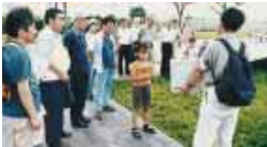
横浜港ポートサイド地区での野草観察会の様子