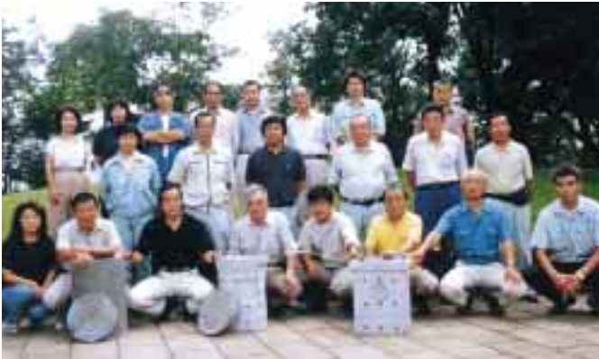
父ちゃん母ちゃんの水道屋さんたち（小金井市指定下水道工事店）

「雨水浸透事業」を通じて推進する市民・水道屋さん・行政のパートナーシップ 東京都小金井市（市民・父ちゃん母ちゃんの水道屋さんたち・行政）