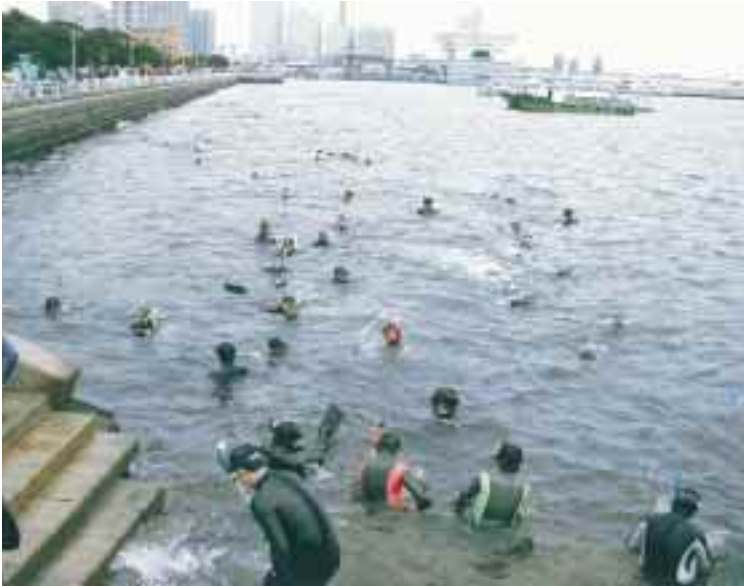
海底清掃の準備運動として“皆で泳ごうYOKOHAMABAY” このウォーミングアップで体をならしその後海底清掃へ進む