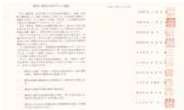
流域4市6町の首長による酒匂川・鮎沢川水系サミット宣言本文