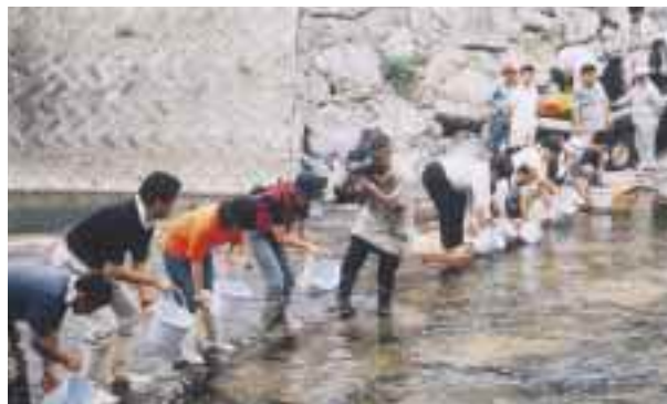
源河川でのリュウキュウアユの稚魚放流式