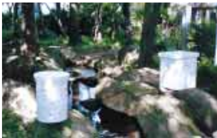
自然環境保全等を図る浸透ます