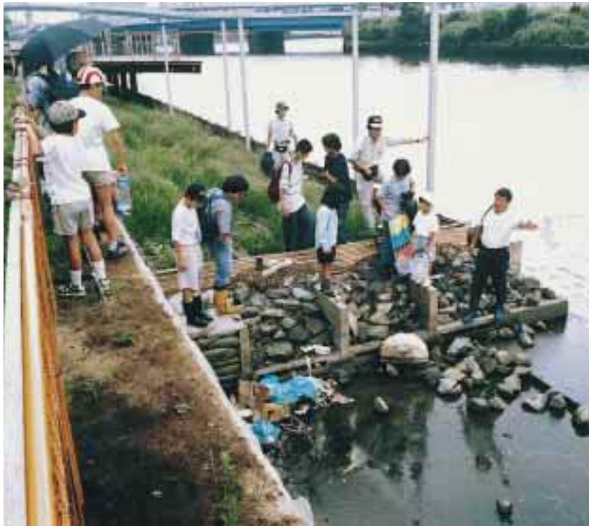
横浜港ポートサイド地区でのカニ観察会の様子