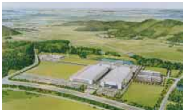
シャープ(株)三重工場全景

生産工程排水の回収・再利用システム構築・運用による水資源の有効利用と地域環境への影響低減 シャープ株式会社 三重工場