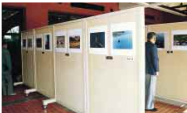
高梁川流域の自然・フォトコンテストの作品展示会 (倉敷市役所会場)