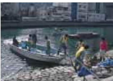
毎月2回、定期的に実施する『ひょうたん島』の河川清掃活動