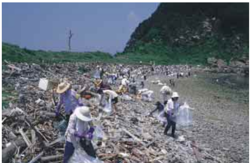
アウトリーチプログラムによる離島「伊島」の海岸清掃活動