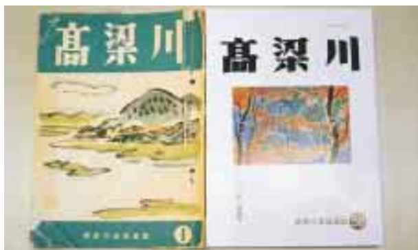
機関誌「高梁川」の1号と最新号の58号の表紙写真