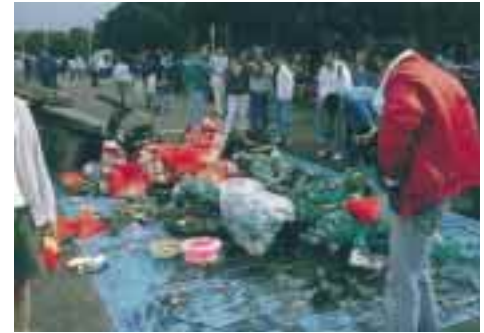
海中から拾い上げられたゴミ山 捨てるのも人なら 拾うも人