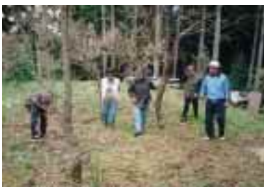
地域の人々との「野鳥の森」の散策