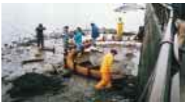
市民参加による造成工事