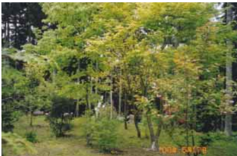
「野鳥の森」の春景色