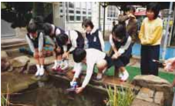
栗っ子ウォーターランドは、子どもたちの夢がかなうところです

総合的な学習「大切にしたい！栗林の水を」 - 節水活動と環境保全活動から - 高松市立栗林小学校