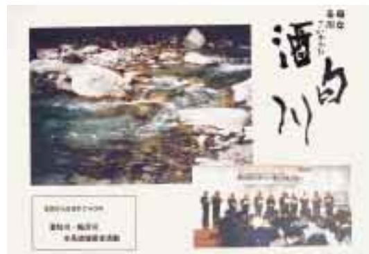
母なる川・酒匂川の流は21世紀を越えて次世代へ