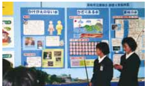
「ふるさとの水」を守るために、地域の人々にも発信しました