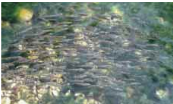
安波ダムの放流直後のリュウキュウアユ