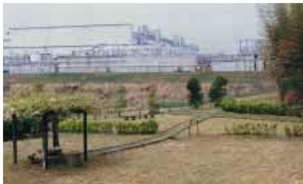
工場内公園よりの水処理施設眺望