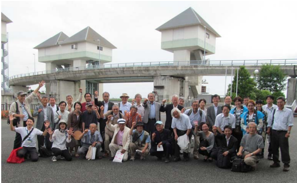
「筑後川フェスティバル in 大川」 花宗水門で三大河川交流 (2016 年)