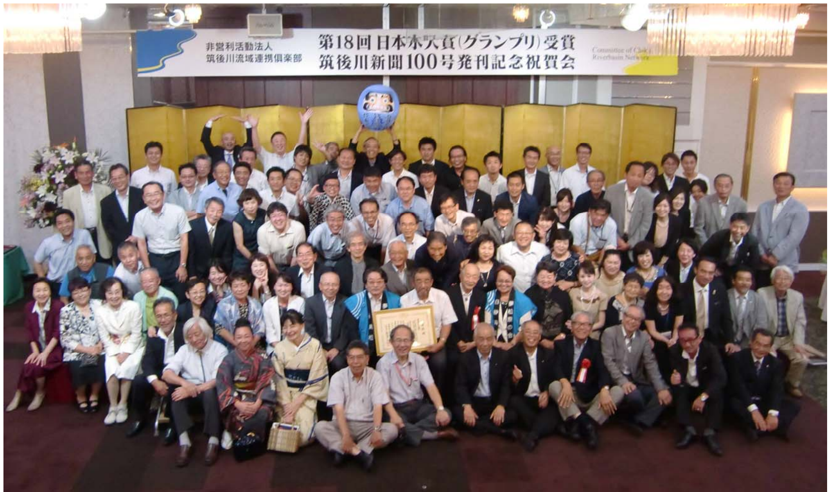
「日本水大賞、筑後川新聞 100 号発刊記念祝賀会」全員集合 (2016 年)

表彰者名 : 特定非営利活動法人 筑後川流域連携倶楽部 様 (福岡県久留米市) 表彰理由 : 平成 10 年に設立以来、筑後川流域の河川活動団体をゆるやかなネットワークでつなぎ、「筑後川フェスティバル」の開催、情報誌『筑後川新聞』の発行、水源林「水の森」の育成活動等を行い、筑後川流域の河川文化の発展、水循環の健全化、地域活性化等に貢献された。 (平成 26 年 河川協力団体に指定, 平成 28 年 日本水大賞受賞)