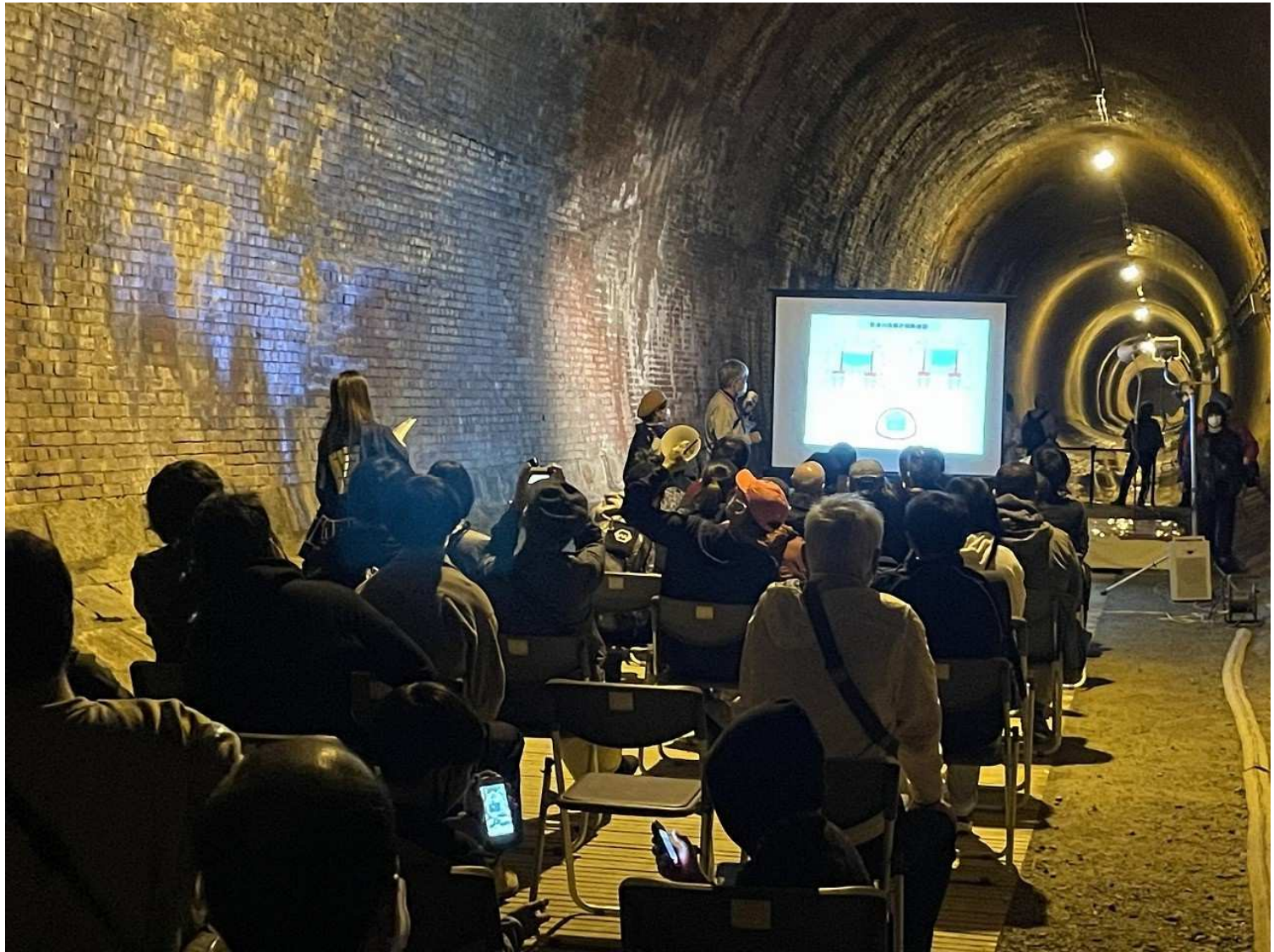
湊川隧道の概要説明

表彰理由 : 平成 13 年の発足以来、神戸を代表する近代土木遺産で我が国初の河川トンネルである「湊川隧道」の保全活動に努め、一般公開や通り抜けウォークなどのイベントに取り組み、歴史を活かした地域の活性化と河川文化の発展に大いに貢献された。