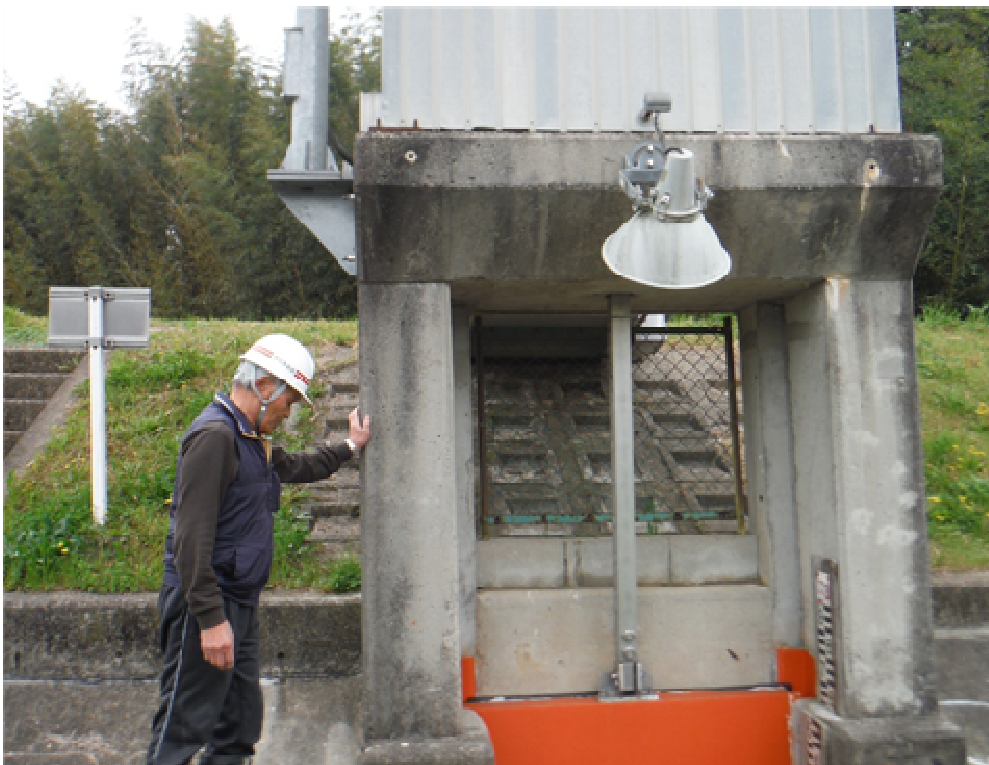
柴栖川北河原排水樋門