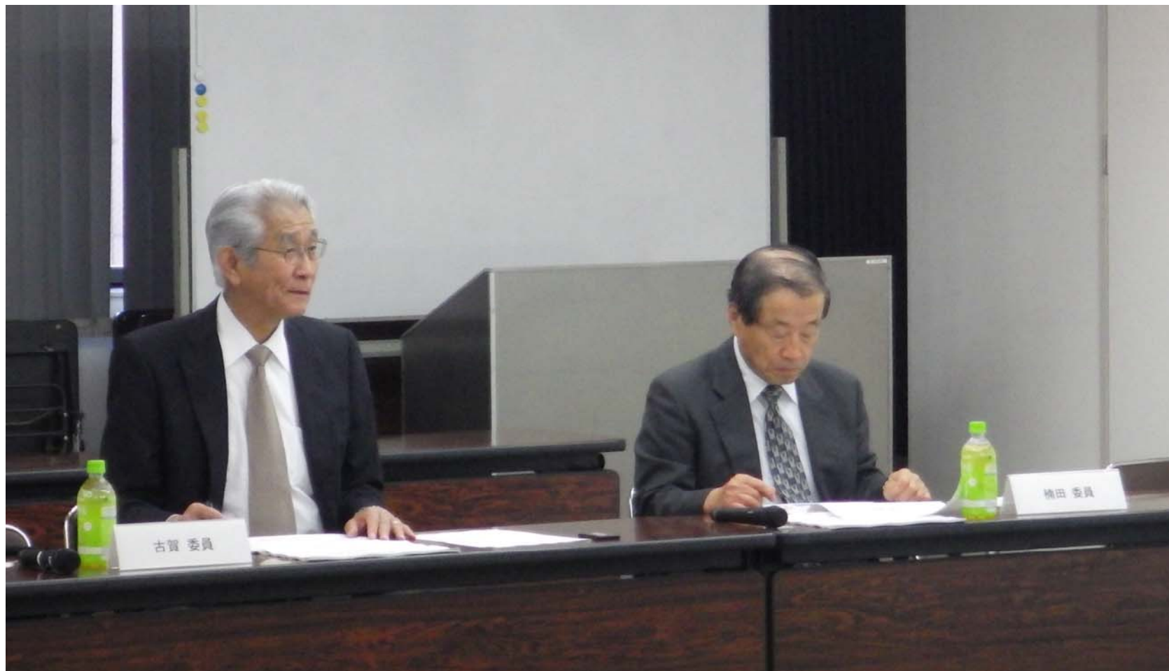
H30年 フォローアップ委員会

表彰理由 : 水環境・水質の専門家として、顕著な研究成果をあげられるとともに、九州地方ダム等管理フォローアップ委員会委員や小石原川ダムモニタリング部会長、筑後川学識者懇談会、六角川・嘉瀬川・松浦川学識者懇談会委員を務められ、河川整備計画の策定、管理ダム環境の改善・保全及び筑後川等の河川整備の推進に貢献された。