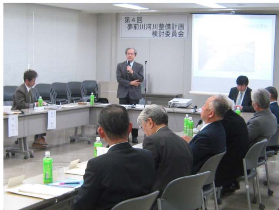
夢前川河川整備計画検討委員会の状況