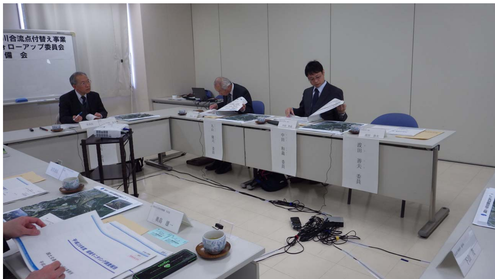
小田川合流点付替え事業環境影響評価フォローアップ委員会