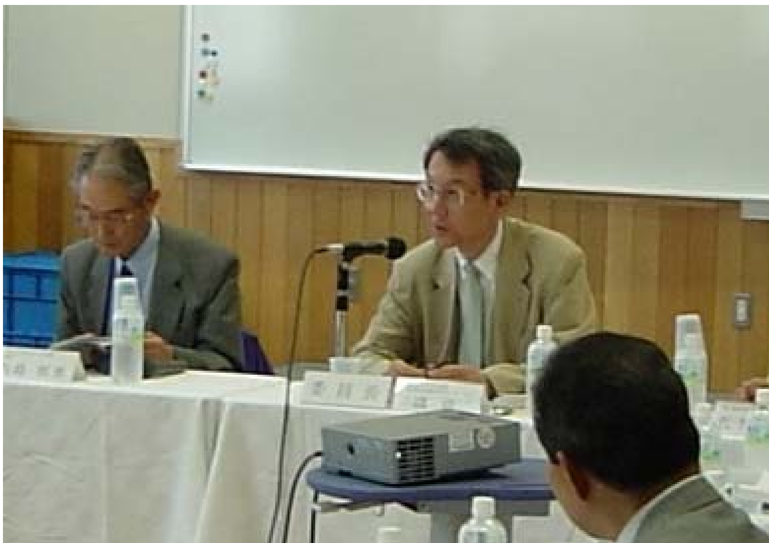
釧路川流域委員会