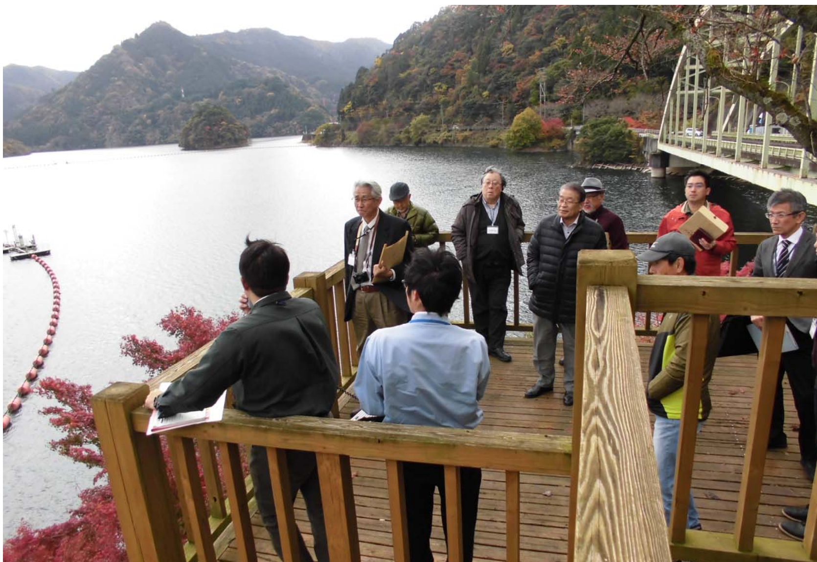
R1年 松原ダム現地検討会