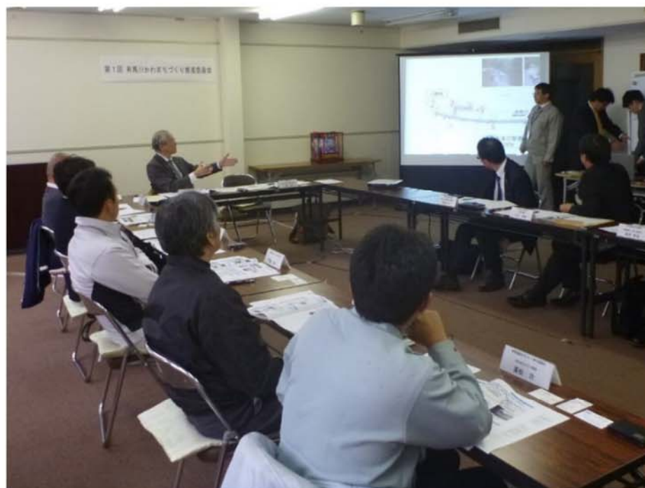
有馬川かわまちづくり推進委員会の状況