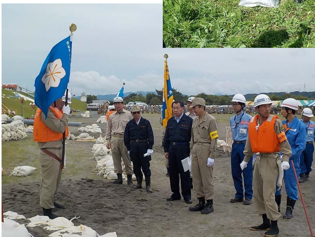
水防演習にて工法説明