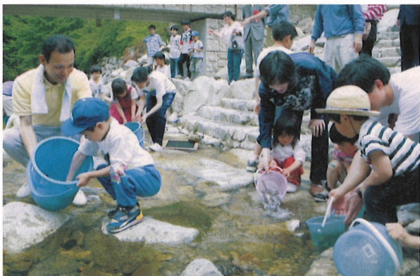
智頭町の「親水公園」での溪流魚（イワナ）の放流の様子です。

全住民参加のサロン方式による川を軸とした村おこし運動 智頭町（ちづちょう）親水公園連絡協議会