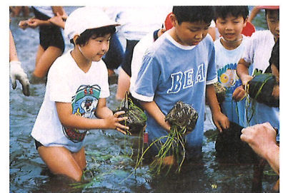
霞ヶ浦にアサザを植える小学生。現在、流域の144の小学校が参加。