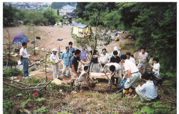
市民の森ワークショップとのピオトープづくりでの協同作業風景