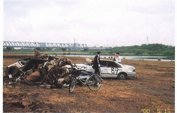
「毎週土曜日朝、自転車に乗って不法投棄調査に出かけるCNS会員」