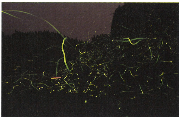
入佐地区の河川に乱舞するゲンジボタル。