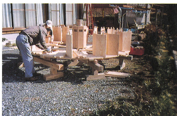
「ふれあい公園 杜のいづみ」に設置した水車の手づくり状況