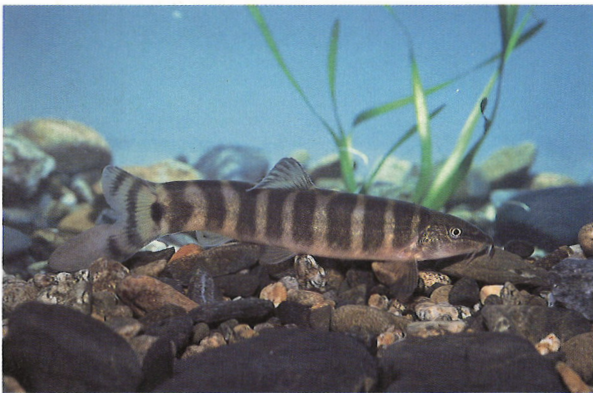
国の天然記念物アユモドキ