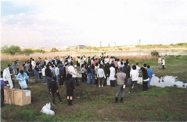
「相模川河川敷でのクリーンキャンペーンで説明をするCNS会員」

流域市民活動の行動と提案による相模川の不法投棄の防止 市民ネットワーキング・相模川 (CNS)