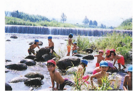
河原は遊びの宝庫—粘土石・草花 たくさん的小動物に出会えます。