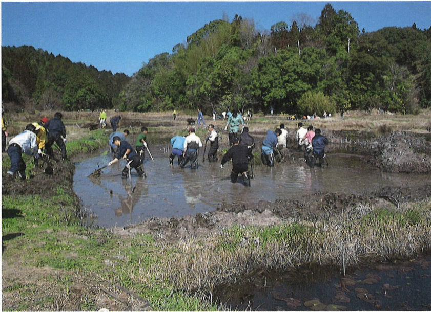
市民ボランティアによる整備作業 里山の生物にとって、除草等適切な管理作業は欠かせない。