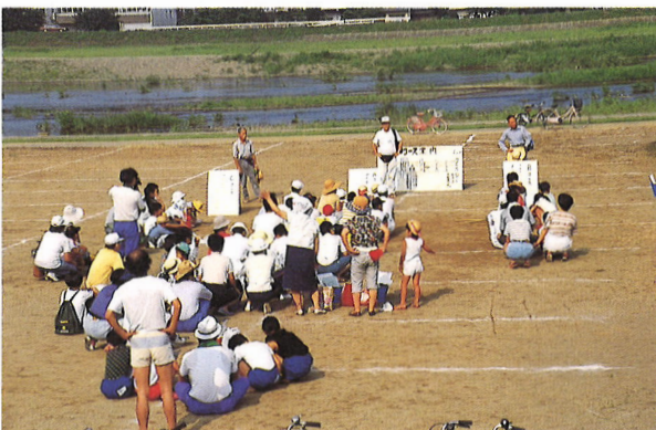
日野川の水生生物による武市夏休み親子環境調査風景

SAET活動：地域の快適な環境づくり（河川及び水環境、他）に関する学習・調査・研究提言活動 丹南地域環境研究会（略称：SAET）Studies Group of Amenity Environment in TANNAN Area