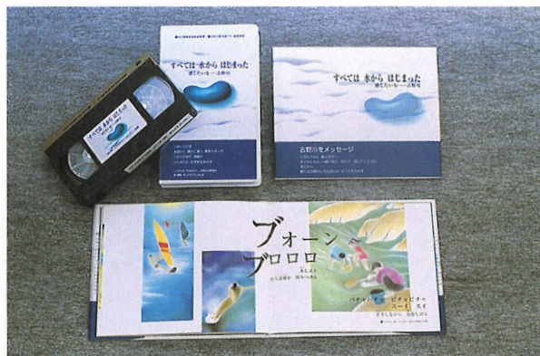
創作絵本・VTRを紹介した写真。