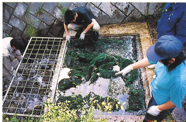
「ホタルの里」での浄化槽に木炭を沈める