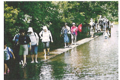
市民・行政・企業の協働（グランドワーク）で甦った源兵衛川。