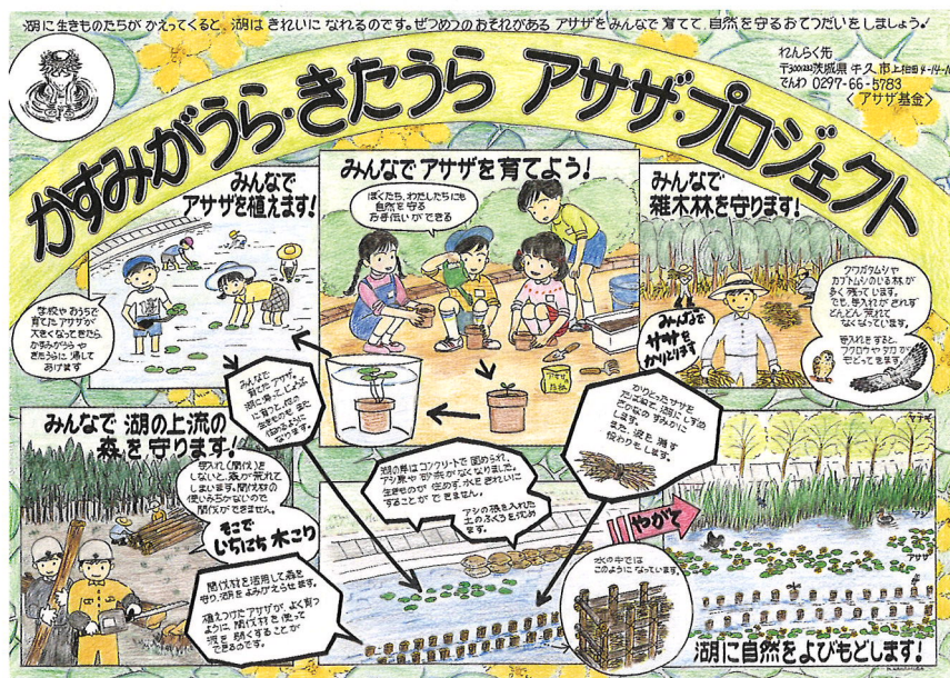
かすみがうら・きたうら アサザ・プロジェクト

湖と森と人を結ぶ霞ヶ浦再生事業「アサザプロジェクト」 霞ヶ浦・北浦をよくする市民連絡会議