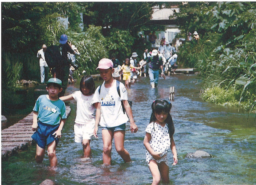
市民・行政・企業の協働（グランドワーク）で甦った源兵衛川。