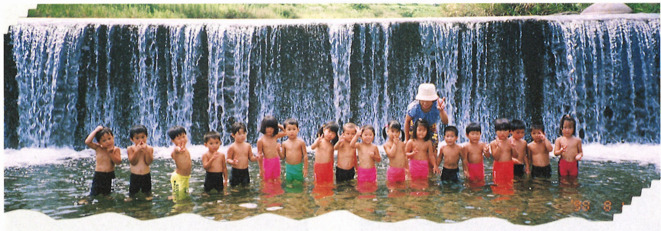
通称“アイダガラの滝”滝ぐり、滝もぐりこの水の勢いは最高！