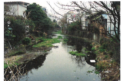
湧水の減少でドブ川化した源兵衛川。悪臭を放つ街の厄介者だった。