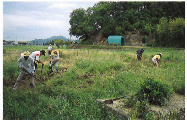
休耕田による自然産卵養殖 急激に減少し、絶滅寸前です。 そこで平成元年より、増殖に取り組んでいます。