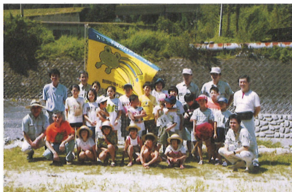
私達がちびっ子河川パトロール隊です。