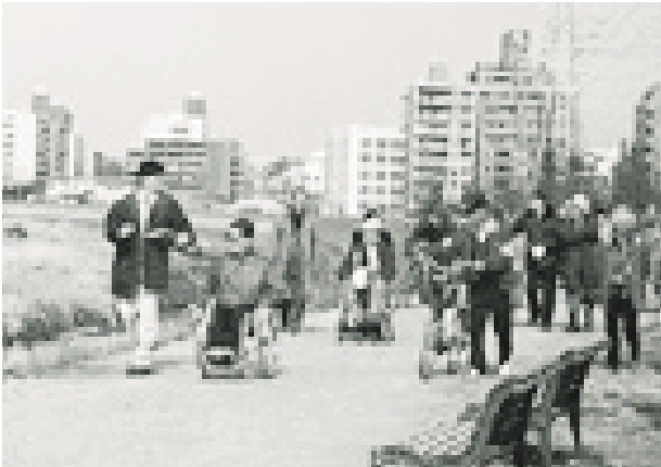
写真3 川と福祉のワークショップによる障害者グループとの合同河川視察（新横浜鳥山川合流点付近）