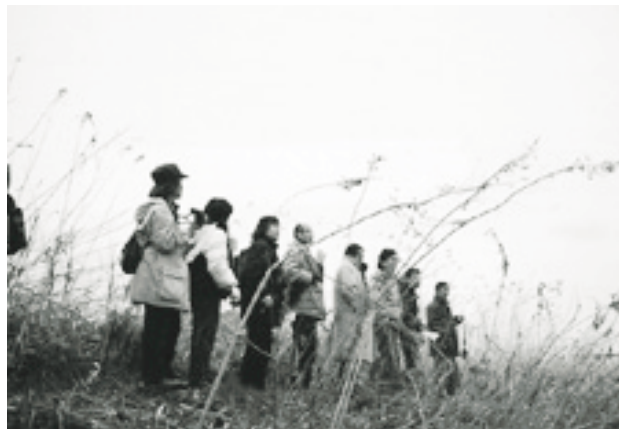
写真2 中流域懇話会の河川視察風景（落合橋下流）

ともに、中流域ネットとしての本川区間の提案をとりまとめています。また横浜治水事務所と連携し、鉄町地先の河川敷の野草管理作業を定期的に行ったり、横浜市緑政局との連携で、佐江戸地先の河川敷の自然観察会と生物調査を行っています。こうした川の自然環境管理作業を通じて、地域への河川環境保全の普及に努めています。