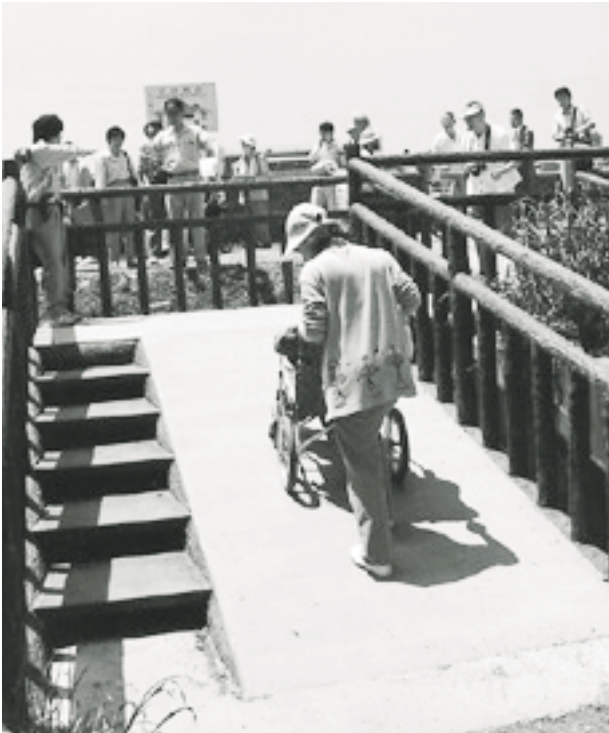
写真6 改良されたスロープを車椅子のグループと点検作業（鶴見川橋下流）

これまで、下流の鶴見区では、身障者グループや福祉グループとともに、車椅子等で川沿いを歩き意見交換を行っています。これを基にできるところからスロープや手摺等を整備し、少しでも身障者の方々が鶴見川に触れられるように、試験的に改善が行われています。また港北区では、福祉グループや関係行政担当者の方々とともに車椅子で同様の点検を行い、意見交換や懇談会を通じて市民提案をまとめつつあります。今後、こうした各サブネットの取り組みを踏まえながら、流域全体で福祉の視点も取り入れた市民提案をとりまとめる予定です。