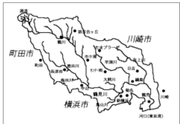
鶴見川流域図：流域面積235km 2 、本川延長24.5km 2 、流域人口約170万人