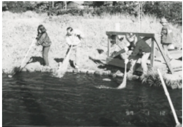
写真1 源流ネットワークによる源流泉の広場の環境管理作業風景

神奈川県区間を対象とし、県、横浜市青葉区・緑区・都筑区・港北区との連携を図るために発足したのが、鶴見川中流域ネットワーク（以下中流域ネット）です。中流域ネットは、河川管理者である神奈川県横浜治水事務所及び各区のまちづくり担当者と、中流域の川づくりや河川管理に関する情報交換を行うために、中流域懇話会を設置しています。この懇話会では、これまでに本川神奈川県区間、支川早淵川と一緒に視察し、現況確認と情報の共有化を図ると