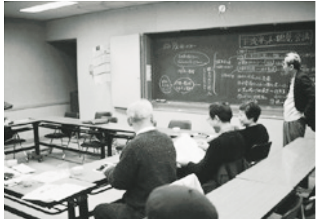
写真4 下流ネット・鶴見による鶴見川下流域の提案をまとめている会議風景

横浜市港北区との連携を図るために発足したのがカワウネット（鶴見川下流ネットワーク港北）です。新横浜の多目的遊水地を初め、港北区区間の沿川地域を含めて、川からのまちづくりプランをまとめるとともに、川と福祉のワークショップ（後掲の身近な河川環境調査プロジェクト参照）を開催し、地域住民団体や福祉グループと合同で綱島から新横浜間を車椅子で調査し、地域懇談会を行い合意を得ながら市民提案をまとめつつあります。そして、関係行政機関へ提案を行い、通称バリケン島（水鳥の生息する中州）の保全など、維持管理も含め、実現に向けて調整が始まっています。