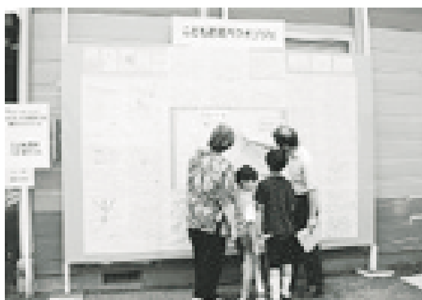
写真5 「ふれあって鶴見川'98」のイベントの一環として流域の小中学校の子どもたちが作成したマップをつないだ「流域バクオブジェ」

流域の小中学校の子どもたちの川での体験を通じて、環境学習や総合学習を推進しようと、環境学習プロジェクトを始めています。すでにいくつかの小中学校では、TRネットメンバーが講師として呼ばれ、先生方と一緒に川での水質や生き物調査、クリーンアップなどの体験学習