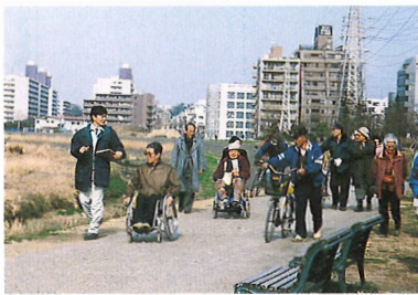
川と福祉のワークショップによる障害者グループとの合同河川視察