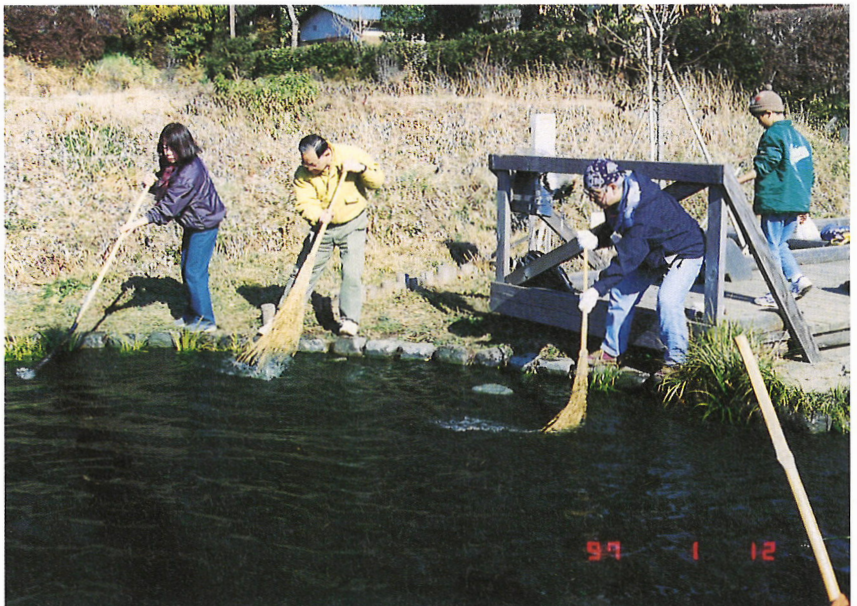
源流ネットワークによる源流泉の広場の環境管理作業風景