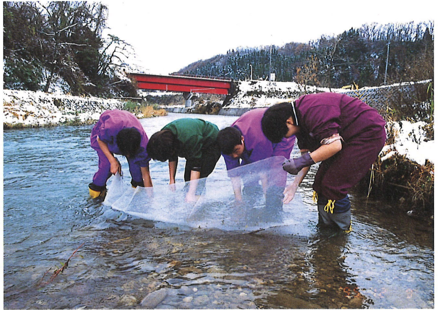
網による定量的な底生物の捕獲