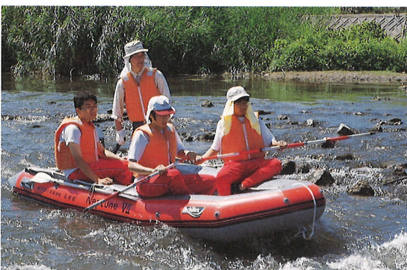
ゴムボートによる最上川水質・景観一斉調査の様子