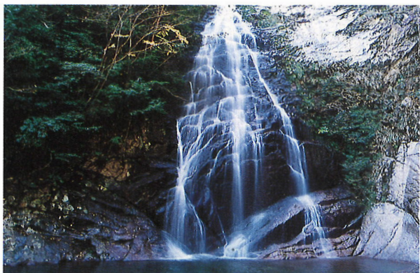
「鹿落しの滝」白山川八景の一つ。高さ30m、今も毎年2〜3頭の鹿が落ちる