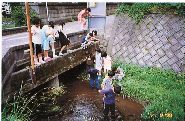
子ども達の水辺観察