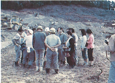
矢作川をきれいにする会のパトロール