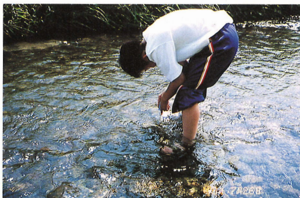
羽沢川（登米町）調査の様子