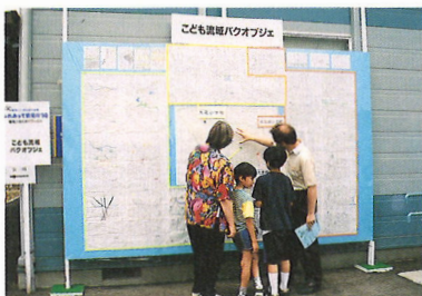
「ふれあって鶴見川'98」のイベントの一環として流域の小学生の子どもたちが作成したマップをつないだ「流域バクオブジェ」