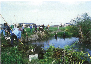
住民と行政の協力による堀の再生