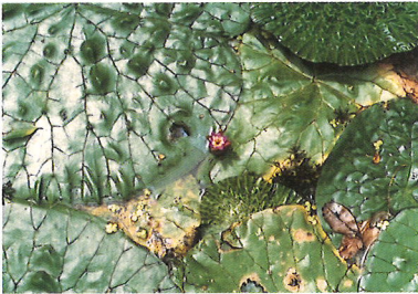
中庭で繁殖させたオニバス