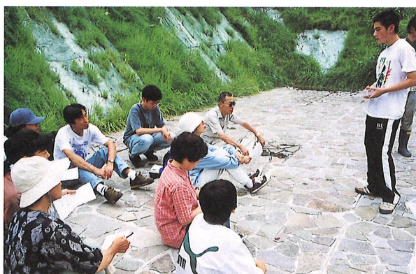
河川観察会での一般市民を指導する