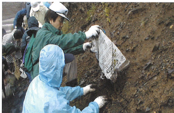
植林ボランティア