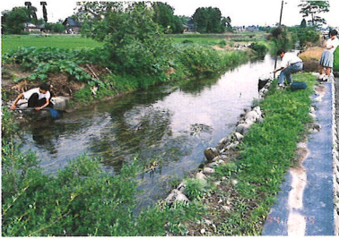
地元の要請でトミヨを放流し、繁殖させた小川