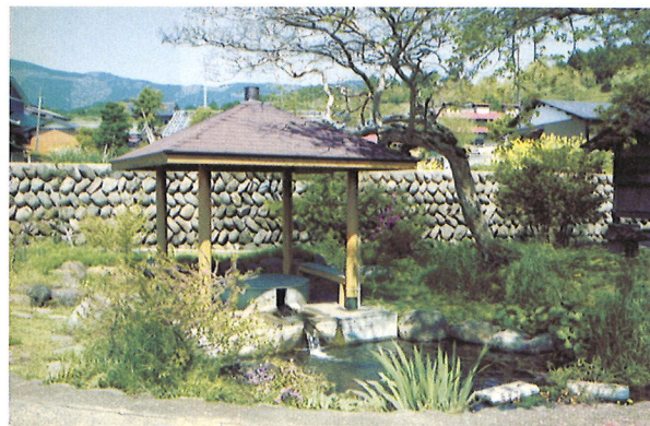
狩野巖島天地湧水