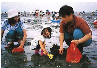
矢部川上・下流交流(有明海学習潮干狩り)