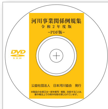
■ PDF版の閲覧には、Adobe Acrobat Readerが必要です。

本例規集は、河川業務担当者の実務に役立てていただくため、河川管理及び河川改修事業（直轄・補助）に関する法令、通知等を編集し、一冊にまとめたものです。