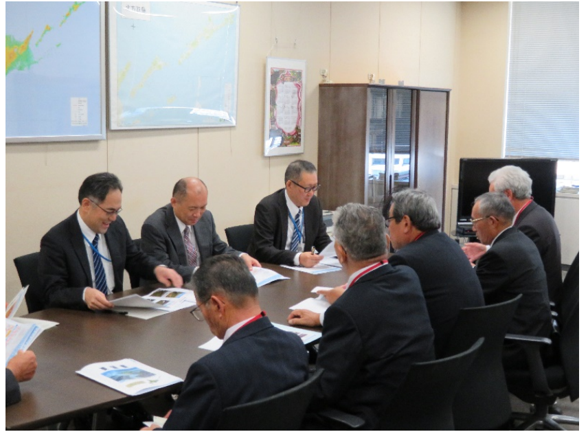
令和元年国土交通省北海道局要望