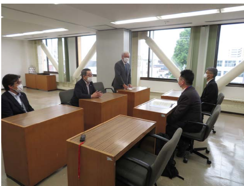
伝達式を終えての懇談の様子