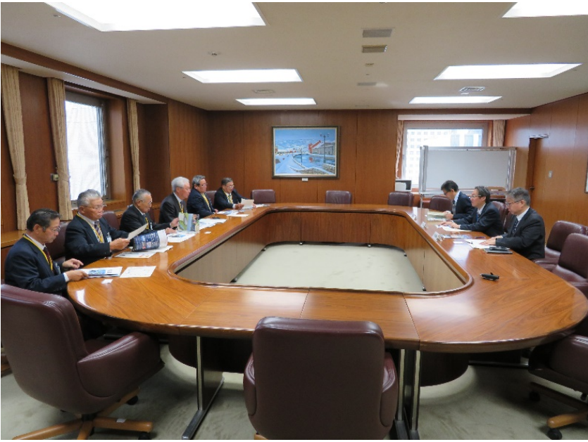
令和元年北海道開発局要望