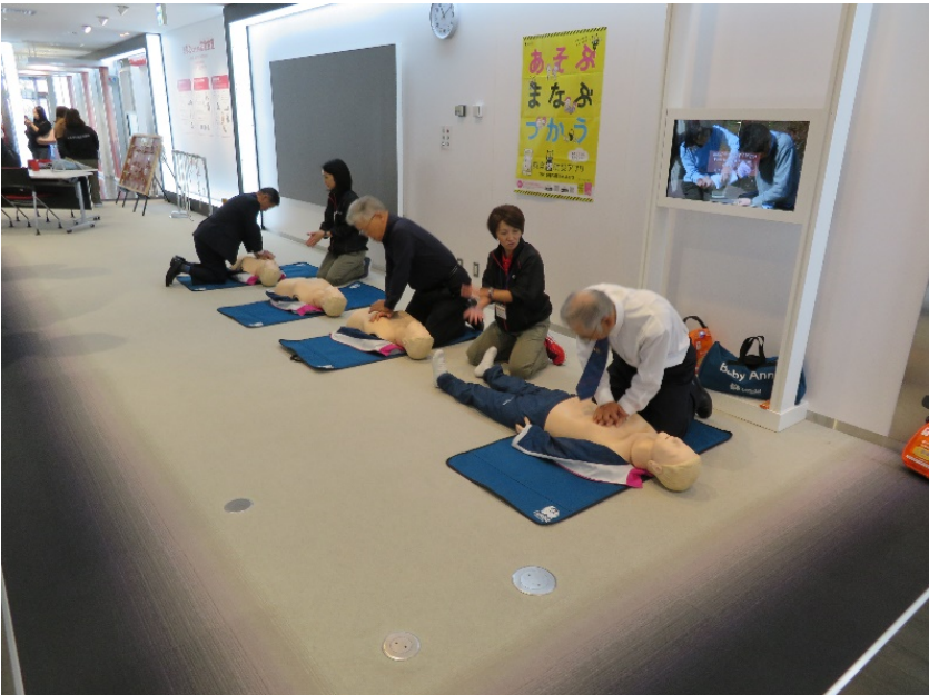
令和元年施設見学 しながわ防災体験館（品川区防災センター）