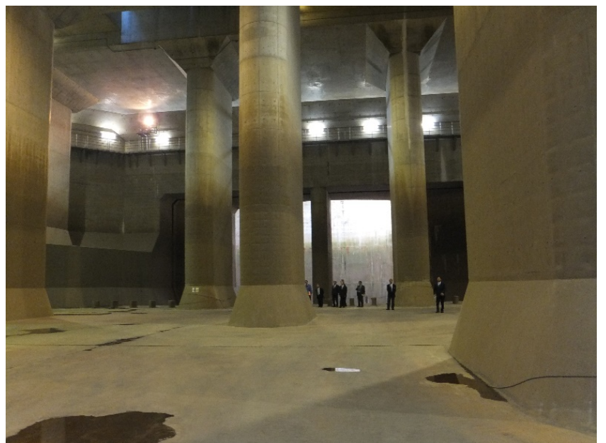
平成26年施設見学 首都圏外郭放水路