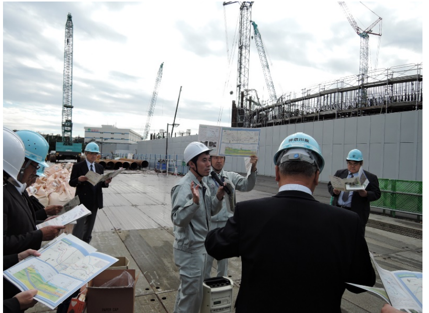
平成30年施設見学 矢上川地下調節施設(工事中)